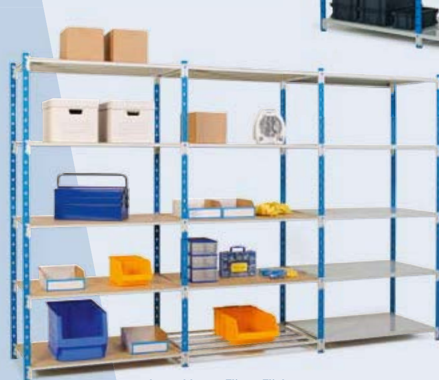
Les tablettes Flip et Fliclass sont entièrement compatibles entre-elles.