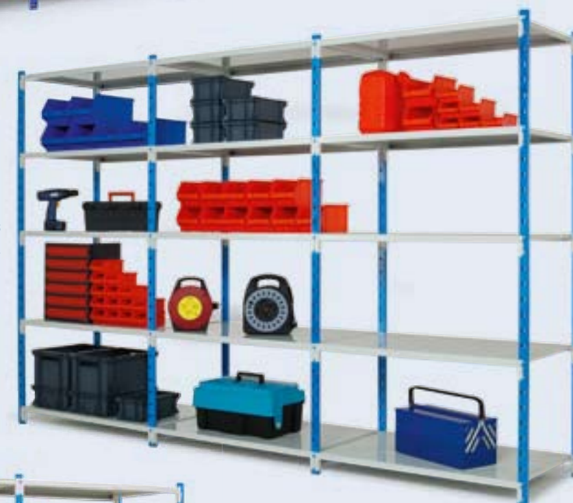
Rayonnage Fliclass avec tablettes tôlées.