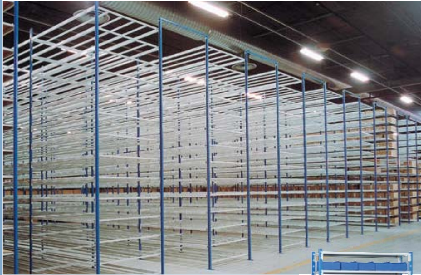
D'une simple travée aux installations les plus conséquentes ... des capacités techniques et des solutions pour satisfaire vos exigences !