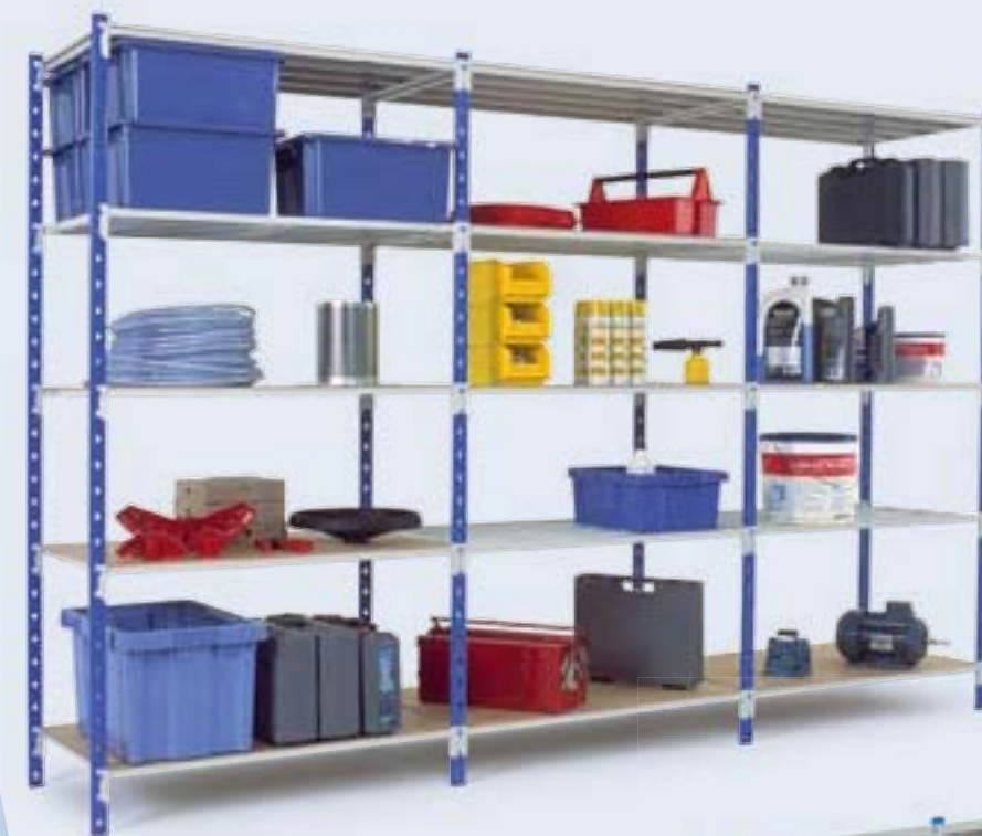
Rayonnage Flip avec tablettes tubulaires et dessus isobois.