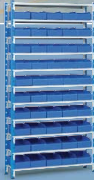
Envie de couleurs : une large palette de coloris RAL à disposition (+5%).